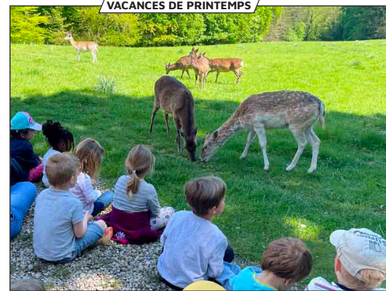
VACANCES DE PRINTEMPS