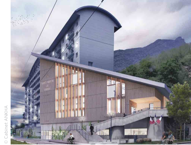
La future façade de l'Hôtel de Ville.