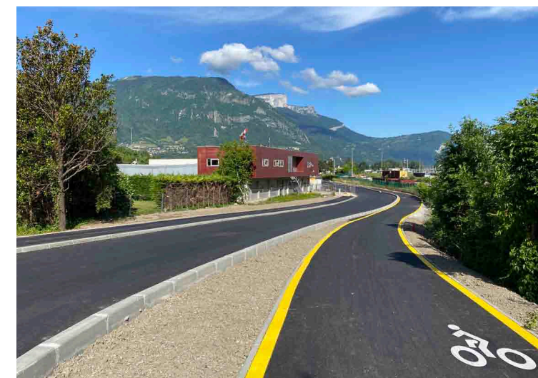
La route et la création de la piste cyclable bidirectionnelle et du trottoir.

Ils marqueront le début de la revalorisation de cette zone, qui verra s'installer de nouveaux bâtiments et de nouvelles entreprises, en continuité de la Presqu'île scientifique.