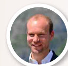
Sylvain Laval Maire de Saint-Martin-le-Vinoux

Rendez-vous est donné au parc des Moais pour une soirée qui vous est destinée - paroles du Maire, musique par le Foyer Arts et Loisirs, restauration, buvette et Bal Disco Funk décoiffant : tous les ingrédients sont réunis pour une soirée riche en émotions !