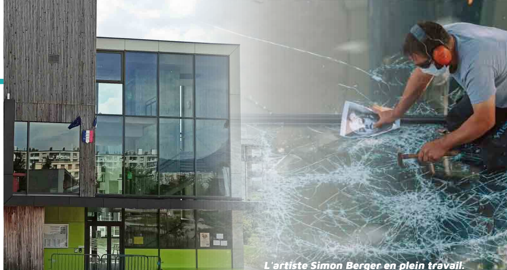
L'artiste Simon Berger en plein travail.

Son œuvre sera posée sur la façade de l'école Badinter élémentaire les 22 et 23 juin.