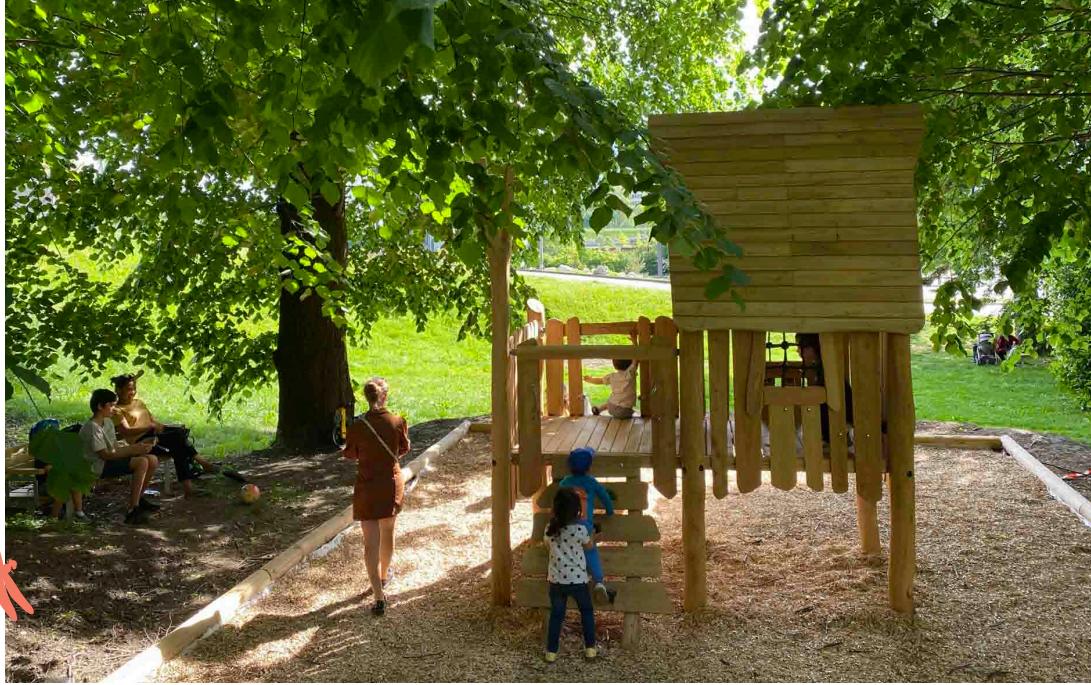
La maison sur pilotis déjà investie par les enfants !