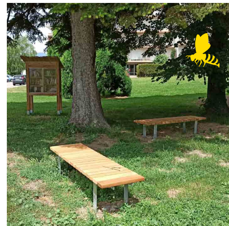
Un des nouveaux bancs, appel à la relaxation. En arrière plan, la boîte à livres.

L'année prochaine à la belle saison, un massif de fleurs et d'autres arbres seront plantés.