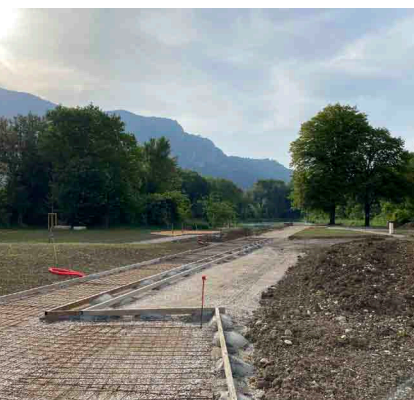
Les aménagements se poursuivent.

La Balme, Gontier, Pique-Pierre et le futur parc de l'avenue Général Leclerc (annoncé dans le journal de janvier 2022), le parc de l'étang Pique-Pierre constituera le 5 ème de la zone urbaine !