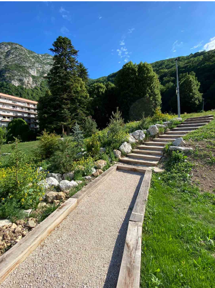
L'escalier et la cascade de rochers.