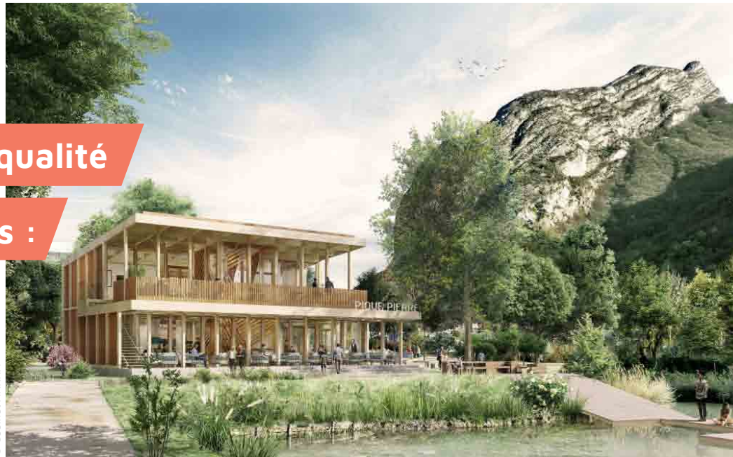
Vue d'artiste de l'espace de restauration, devant l'étang.