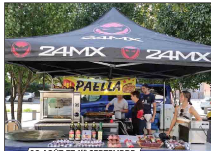
30 AOÛT ET 1 ER SEPTEMBRE