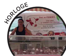
GAEC DE FUGIÈRES