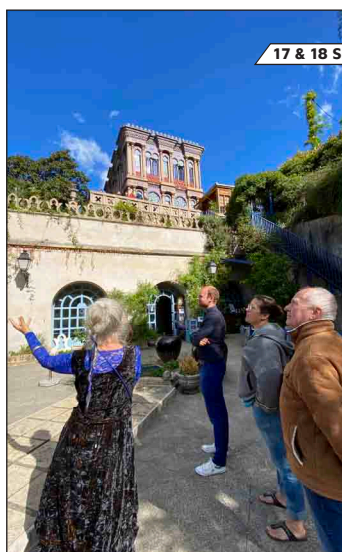
17 & 18 SEPTEMBRE