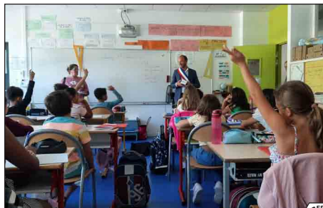
1 ER SEPTEMBRE