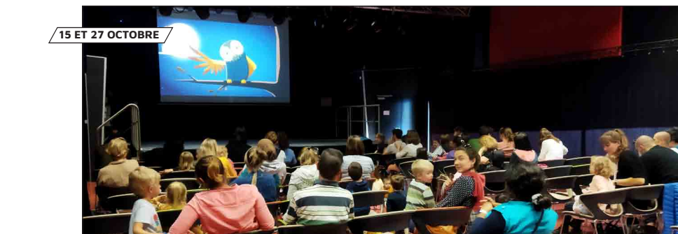
15 ET 27 OCTOBRE