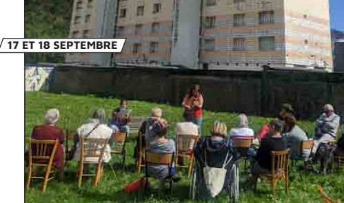
17 ET 18 SEPTEMBRE