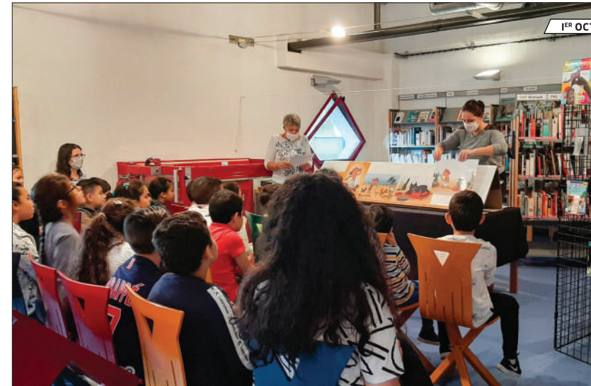
1 er OCT.